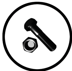
Salgó csavar és anya