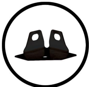
Salgó szimpla talp