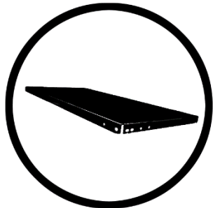
Csavaros salgó polc